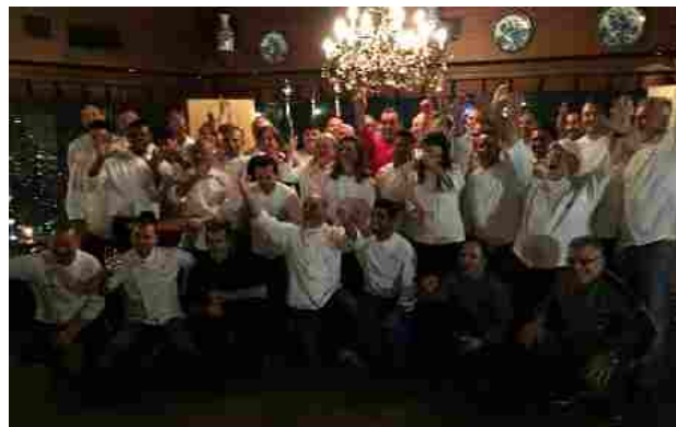
(Gli chef italiani e brasiliani che hanno preso parte alla manifestazione dello scorso anno)

Venti ristoranti brasiliani proporranno ognuno le ricette tipiche di una regione italiana. La Sicilia sarà rappresentata dall'Antica Filanda di Capri Leone